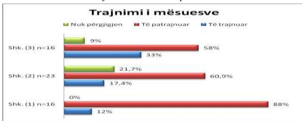
Grafiku 2. Mbi trajnimin e mësuesve sipas shkollave.

Pjesëmarrësit në fokus-grup mbulonin këto detyra: përfaqësues të ZVA; nën/drejtor; mësuese të parashkollorit si dhe mësuese të arsimit fillor.