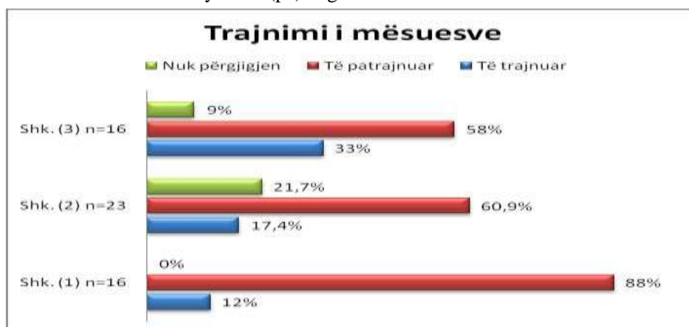
Grafiku 1. Mbështetja që i jepet mësuesve kur kanë në klasë nxënës me aftësi ndryshe të (pa)diagnostikuar.

Për pyetjen: “Kush ju mbështet nëse keni edhe nxënës që janë me aftësi ndryshe?” ja disa nga përgjigjet, Int.(1) shk. (2) “Më mbështet vetëm një kolege e grupit tjetër, ndërsa prindi, jo”; Int.(1) shk. (1) “Nuk është i diagnostikuar, do të më ndihmonte shume nëse do të ishte i tillë. Nuk më ndihmon askush”; Ja si përgjigjet një mësues tjetër, Int. (4) shk. (1) “Jo askush nuk të mbështet, çdo mësues duhet të hartojë një PEI ose të arrijë i vetëm realizimin e programit”; apo Int. (2) shk. (2) “kam mbështetje nga mësuesi ndihmës”; Int.(3) shk. (2) “Nuk na mbështet askush”; Int.(5) shk. (2) “Mbështetje të plotë kam pasur nga psikologu i shkollës”.